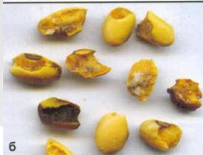
Повреждение бобов и семян сои акациевой огневкой