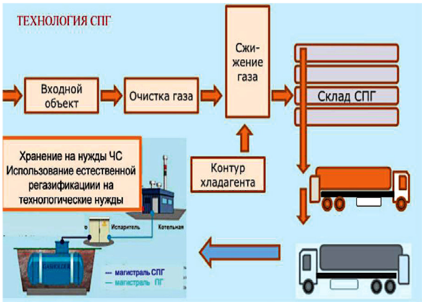
Принципиальная схема технологии получения и распределения СПГ

Получение СПГ является ключевым звеном в построении инфраструктуры его производства, хранения, распределения и потребления. Целесообразно размещать установки по получению СПГ на газораспределительных станциях, что позволяет использовать давление газа в трубопроводе для осуществления технологического цикла и тем самым исключить затраты на компрессоры и энергию для их привода. При реализации подобной схемы сжижается только часть газового потока (10–15 %), а остальной газ с понижением давления направляется потребителю.