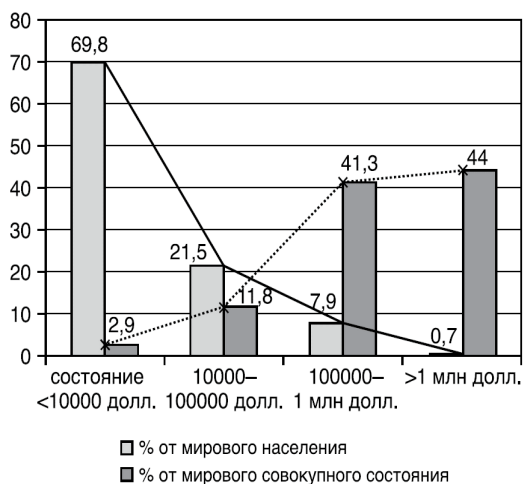
Рис. 2. Глобальное денежно-имущественное расслоение

итоге ИКТ привели к усилению дезинтеграции мировой экономики [4].