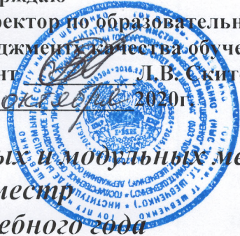
График проведения контрольных и модульных мероприятий на I семестр 2020-2021 учебного года по физико-математическому факультету