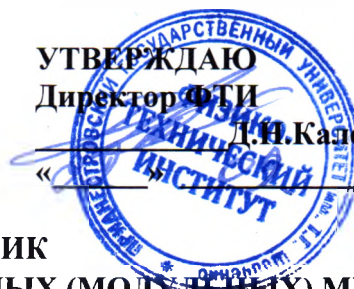
ГРАФИК ПРОВЕДЕНИЯ ТЕКУЩИХ КОНТРОЛЬНЫХ (МОДУЛЬНЫХ) МЕРОПРИЯТИЙ НА 2 ПОЛУГОДИЕ 2023-2024 УЧЕБНОГО ГОДА ФАКУЛЬТЕТА ИНФОРМАТИКИ И ВЫЧИСЛИТЕЛЬНОЙ ТЕХНИКИ ФИЗИКО-ТЕХНИЧЕСКОГО ИНСТИТУТА