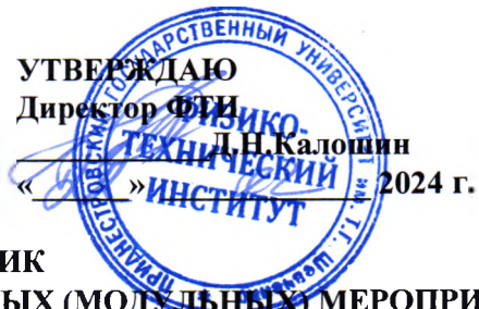
ГРАФИК ПРОВЕДЕНИЯ ТЕКУЩИХ КОНТРОЛЬНЫХ (МОДУЛЬНЫХ) МЕРОПРИЯТИЙ НА 2 ПОЛУГОДИЕ 2023-2024 УЧЕБНОГО ГОДА ИНЖЕНЕРНО-ТЕХНИЧЕСКОГО ФАКУЛЬТЕТА ФИЗИКО-ТЕХНИЧЕСКОГО ИНСТИТУТА