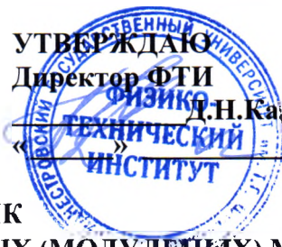
ГРАФИК ПРОВЕДЕНИЯ ТЕКУЩИХ КОНТРОЛЬНЫХ (МОДУЛЬНЫХ) МЕРОПРИЯТИЙ НА 2 ПОЛУГОДИЕ 2023-2024 УЧЕБНОГО ГОДА ФАКУЛЬТЕТА ИНФОРМАТИКИ И ВЫЧИСЛИТЕЛЬНОЙ ТЕХНИКИ ФИЗИКО-ТЕХНИЧЕСКОГО ИНСТИТУТА