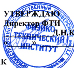
ГРАФИК ПРОВЕДЕНИЯ ТЕКУЩИХ КОНТРОЛЬНЫХ (МОДУЛЬНЫХ) МЕРОПРИЯТИЙ НА 2 ПОЛУГОДИЕ 2023-2024 УЧЕБНОГО ГОДА ФАКУЛЬТЕТА ИНФОРМАТИКИ И ВЫЧИСЛИТЕЛЬНОЙ ТЕХНИКИ ФИЗИКО-ТЕХНИЧЕСКОГО ИНСТИТУТА