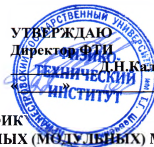
ГРАФИК ПРОВЕДЕНИЯ ТЕКУЩИХ КОНТРОЛЬНЫХ (МОДУЛЬНЫХ) МЕРОПРИЯТИЙ НА 2 ПОЛУГОДИЕ 2023-2024 УЧЕБНОГО ГОДА ИНЖЕНЕРНО-ТЕХНИЧЕСКОГО ФАКУЛЬТЕТА ФИЗИКО-ТЕХНИЧЕСКОГО ИНСТИТУТА 2 курс(специалитет)