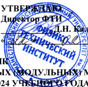
ГРАФИК ПРОВЕДЕНИЯ ТЕКУЩИХ КОНТРОЛЬНЫХ (МОДУЛЬНЫХ) МЕРОПРИЯТИЙ НА 2 ПОЛУГОДИЕ 2023-2024 УЧЕБНОГО ГОДА ИНЖЕНЕРНО-ТЕХНИЧЕСКОГО ФАКУЛЬТЕТА ФИЗИКО-ТЕХНИЧЕСКОГО ИНСТИТУТА