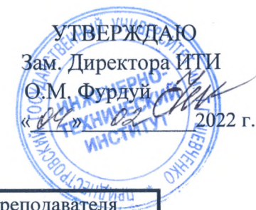
График проведения рубежных контрольных мероприятий (модульного контроля) по дневному отделению ИТИ по группам На II полугодие 2021 – 2022 учебного года IV КУРС