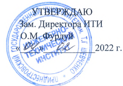
График проведения рубежных контрольных мероприятий (модульного контроля) по дневному отделению ИТИ по группам На II полугодие 2021 – 2022 учебного года I КУРС (Магистратура)