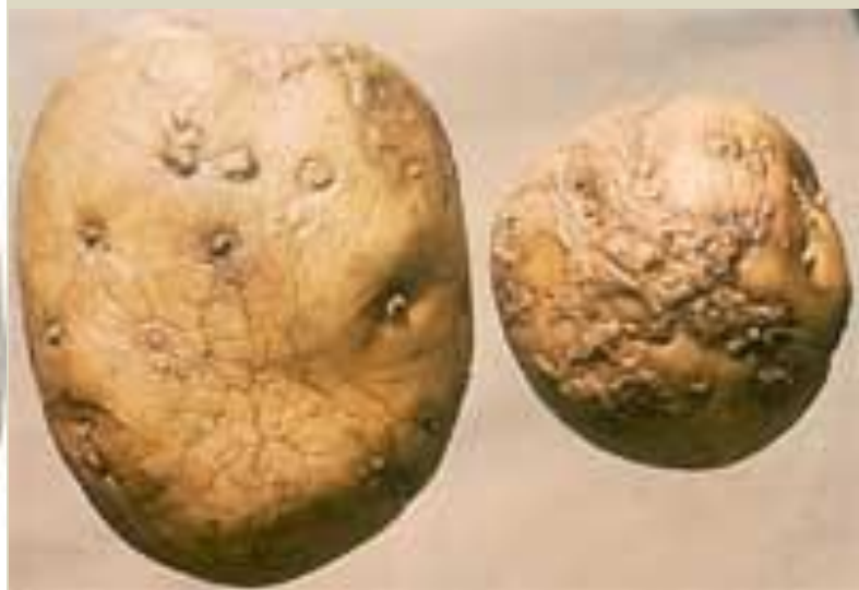
Бугорчатая парша (ооспороз)