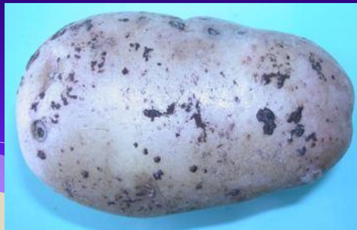
Ризоктониоз, или черная парша